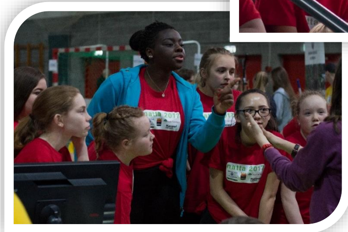
Aktivitsbilder fra NATTA 2017.

NATTA: Natta har blitt arrangert hele 18 ganger i Kongsvingerhallen.