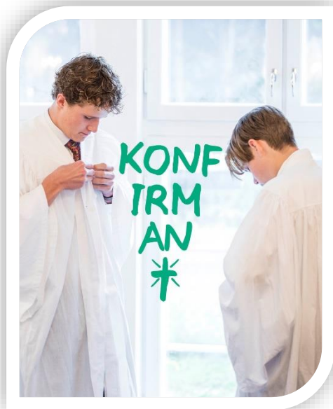
Foto: Illustrasjonsbilde. Foto: von skråstrek Kirkerådet, begge bildene.