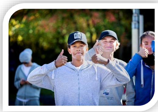
Foto: Illustrasjonsbilde.