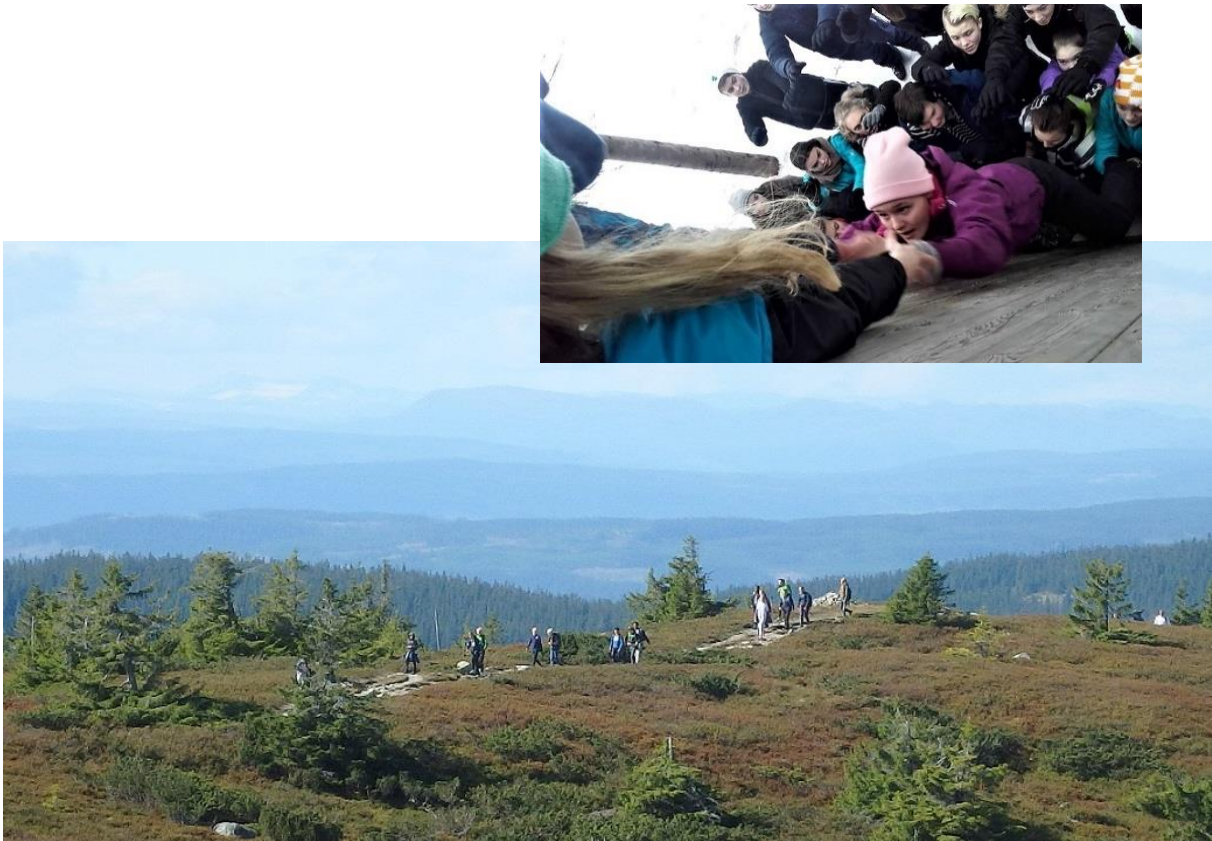
Foto: 3 bilder fra Camp Sjusjøen