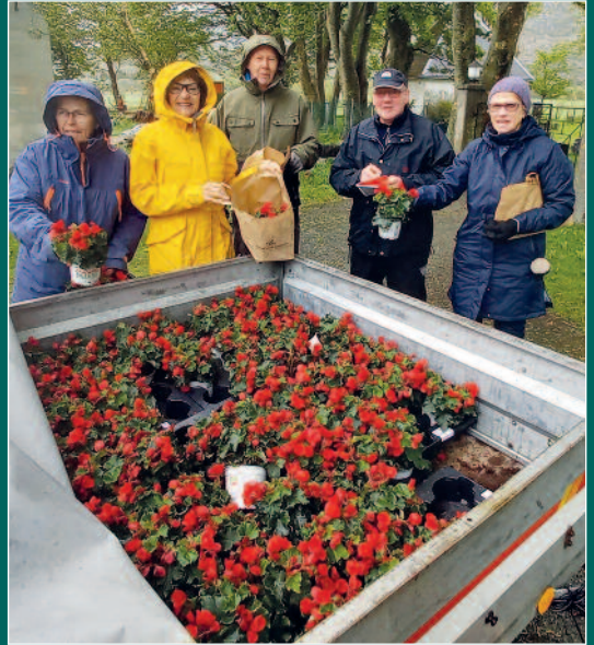
Plantedag ferdig vannet på Nes.