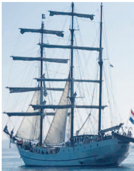
Tall ships race i 2018.

Sommeren er den tiden av året hvor skoleelever og studenter kanskje får litt tid til å tenke på helt andre ting enn innleveringer og eksamener. Mange er kanskje midt i mellom skoler og til høsten begynner de på ny skole; det kan være ungdomsskole, videregående, universitet eller de skal ut i lære. Noen skal kanskje flytte hjemmefra for første gang og det er mange tanker rundt å bo for seg selv.