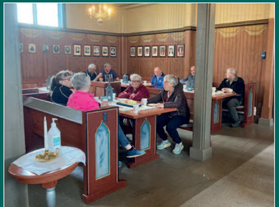
Jøssund kaffekos ryddedag.

BLI FAST GIVER TIL MENIGHETSBLADET VÅRT Kontakt banken din og opprette et fasttrekk til konto: 4295.21.19707 VIPPS: 657081 - Bjugn sokn (Menighetsbladet Bjugn Menighet)