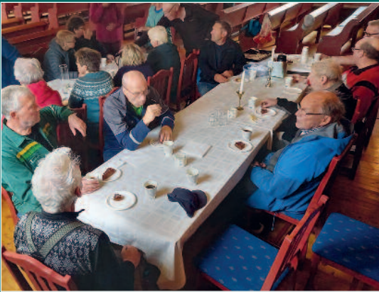
Kaffeprat ryddedag Nes.