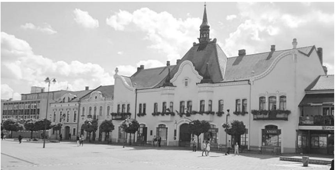
Rådhuset i Topoľčany