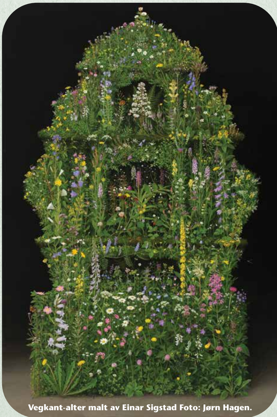
Vegkant-alter malt av Einar Sigstad