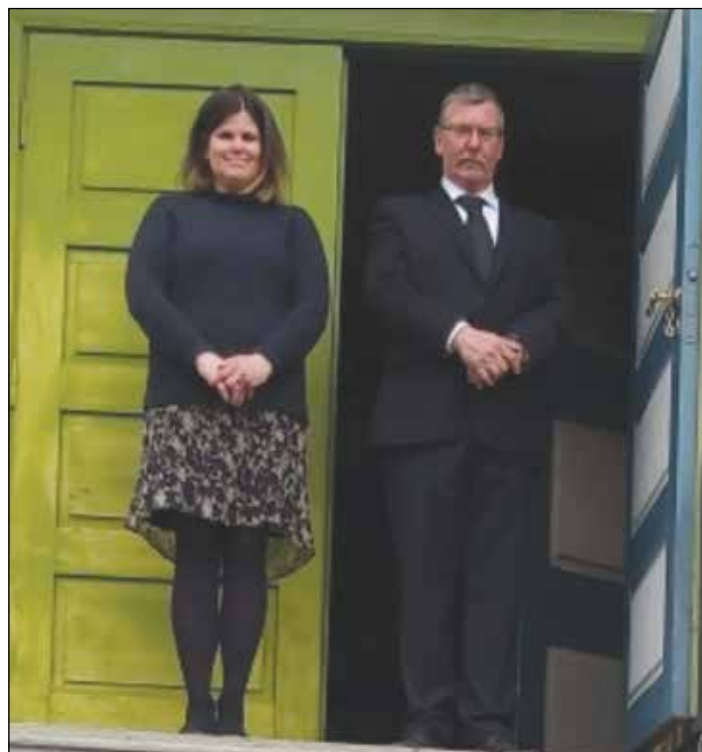
Klare til å ta imot gravferdsfølget.