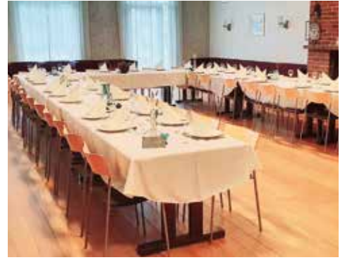
Nå er det god plass til både gjester og kokk i Gand kirke.

Vil du leie lokale i Gand kirke - eller i Gandalen menighetscenter – så skal du ikke nøle med å ta kontakt. Se info på gand.no/utleie .