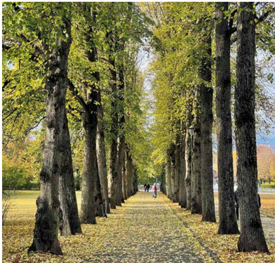
«Portaler til tro» ønsker å gi rom for noe større og gjøre Gud mer tilgjengelig.

Din portal: Mennesker er forskjellige, og trosrommet er stort. Denne portalen handler om å være der du er – i det som betyr noe for deg.