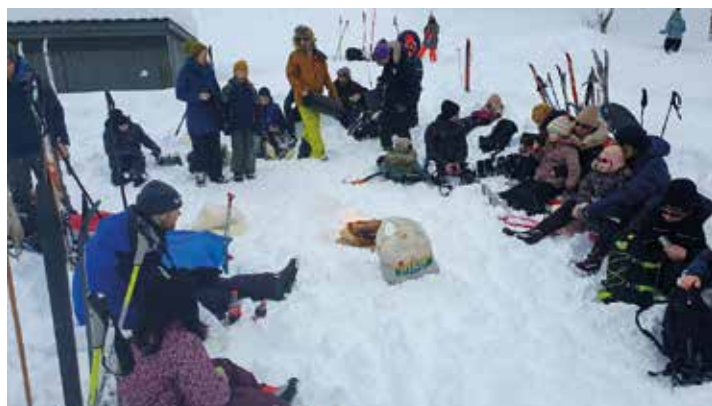
Bål, aking og skitur på Kvæven.

Laurdagen tok folket av garde. 20 tøffingar tok turen i trekket, medan resten reiste til Kvæven for å nyte livet på flata. Det vart gått opptil fleire