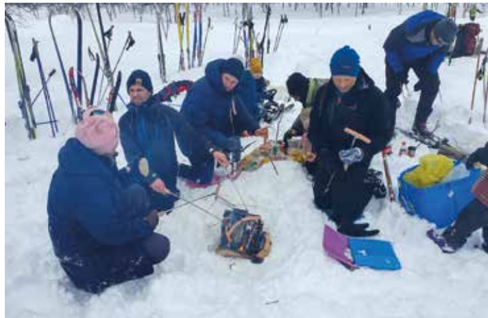
Alltid en god mannfolk-aktivitet å passe på grillpølsene.

Det er berre å beklage, men årets vakraste eventyr er allereie ferdig: nokre-og-sytti medlemmar i kyrkjelyden tok ein week-end-tur til Liland igjen.