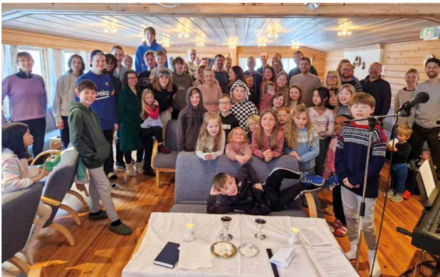
Verdens fineste menighetsfolk på tur!