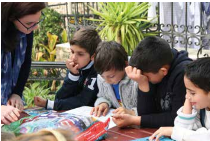
Søndagsskolen i Antalya.

Historien til Toprak: Å respektere at man har ulik tro.