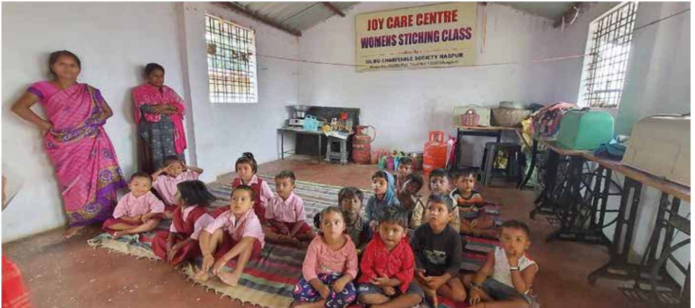
Elevar i Malik Nagar.

Julebygda menighet sitt misjonssprosjekt i Umred, India. I august 2023 starta me skuledrift i eit nytt slumområde i Umred som heiter Birsha Kuhi. Der er det nå 40 barn, ein lærar, ein kokk og ein assistent. Barna får undervisning, og eitt varmt måltid mat kvar skuledag.