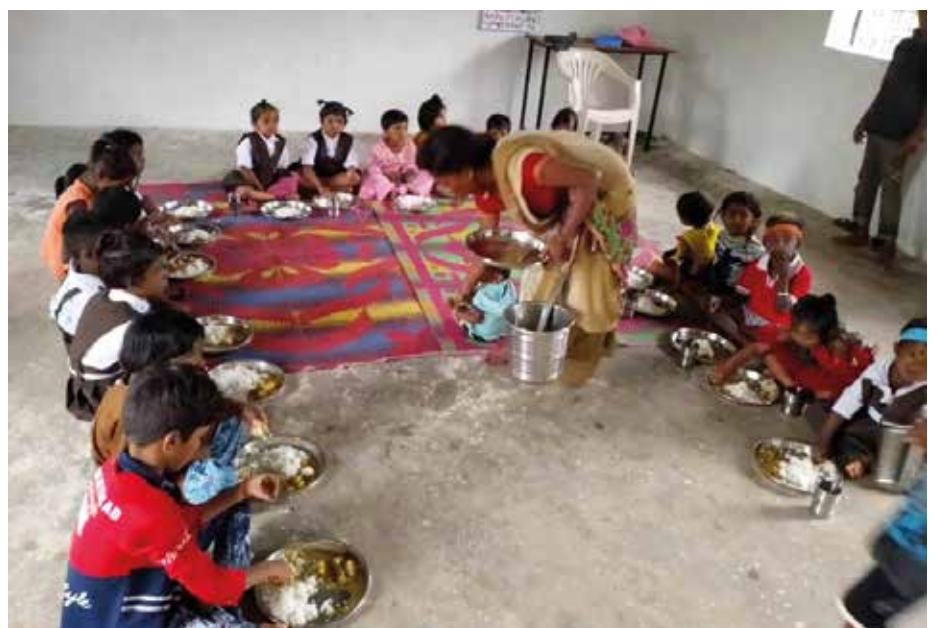
Elevar i Malik Nagar

Men kongen skal svara dei: «Sanneleg, eg seier dykk: Alt de gjorde mot eit av desse minste syskena mine, det gjorde de mot meg.»