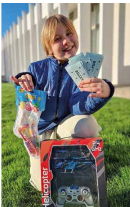
På julebasaren kan både små og store vinne fine gevinster, og barna kan få seg egne barnepenger.

Vinteren 2022 var kirkens kjøkken og menighetssal under ombygging, men vi fikk til en fantastisk tilstelning likevel. Vi er velsignet med en stor kirke med mange rom og mange