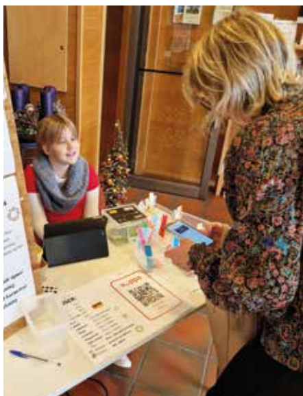
Åresalget gikk så det suste i 2022. Vi ser frem til gjentakelse i år.

Håper vi sees, lørdag 2. desember i Gand kirke mellom kl. 11-14. Dørene åpnes 10.30.