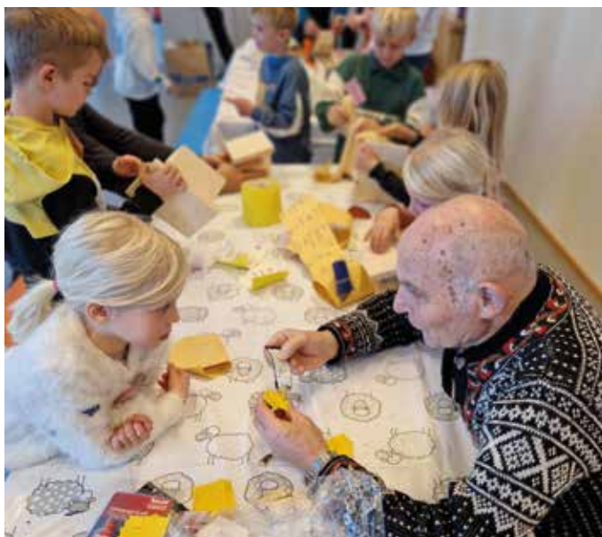
Koselige minner fra Miljødetektivdagen tidligere år.