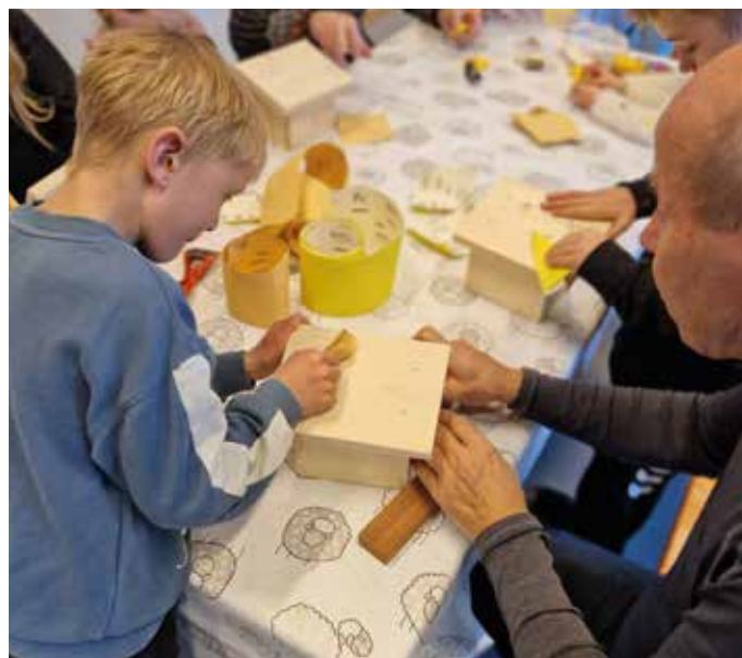
2.klassinger bygger julekrybber sammen med de gode pensjonistene våre.