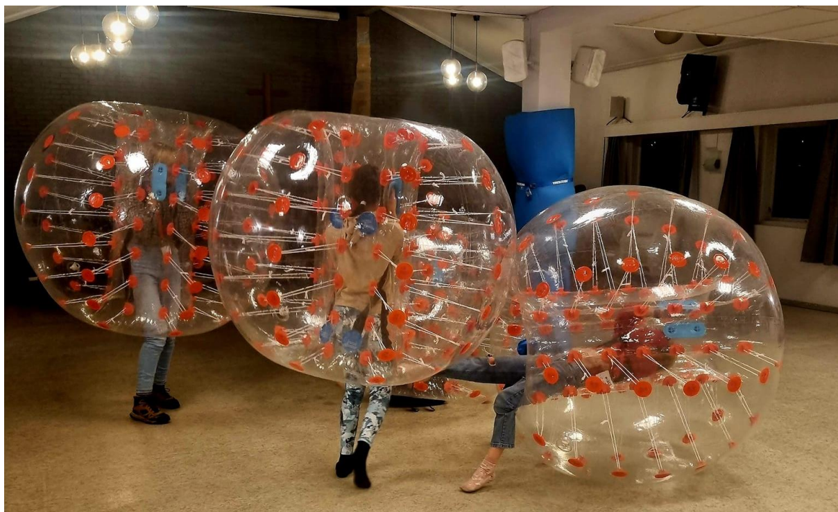
Lek med zorbballer på menighetshuset under Lys Våken i Høyland kirke