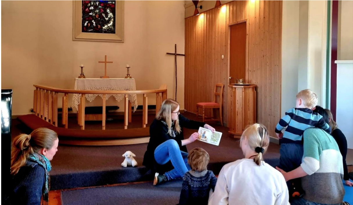
Krøllesamling i Sviland kyrkje for 2- og 3- åringer