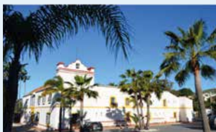
Sjømannskirken i Costa del Sol.