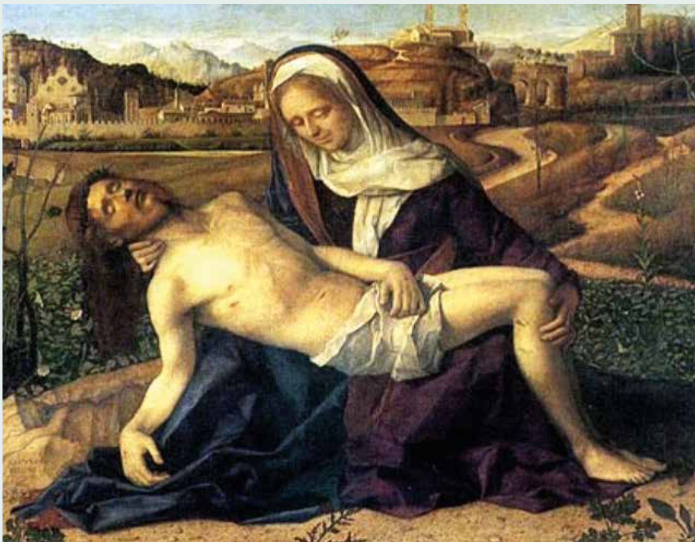
Stabat mater, – den sørgende Maria med Jesus.