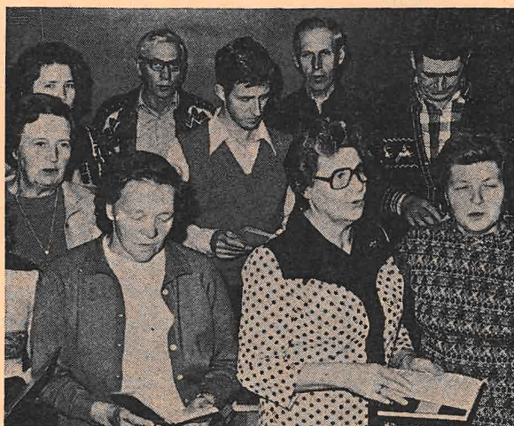
Syslekoret har lovet å hjelpe til med å innføre den nye liturgien i Snarum kirke.

Men for at overgangen skal gå fint, er det viktig at nettopp du møter opp og synger med. Kanskje kunne dette føre til en liturgisk fornyelse i kirken vår. Slik at flere fikk oppleve gudstjenestens rikdom.