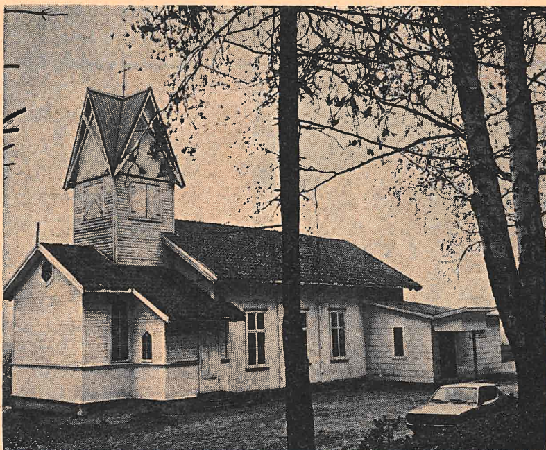
Åmot kapell sett fra øst. Inngangen til høyre med det nye tilbygget med kjøkken og sanitæranlegg.