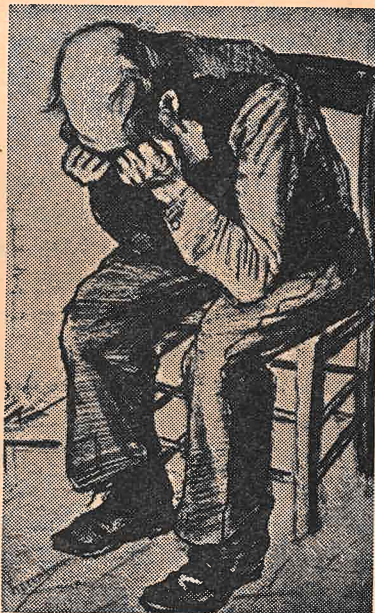
Gammel mann. Tegning av Vincent Van Gogh.

En mann er død. Presten kommer på besøk for å snakke med enken før begravelsen. «Men ingen prest besøkte ham under sykeleiet», sier hun bebreidende til meg. Dette opplever en av og til, og er alltid like sårt å høre. «Men hvorfor sendte du ikke bud etter meg, hvorfor ba du meg ikke komme?»