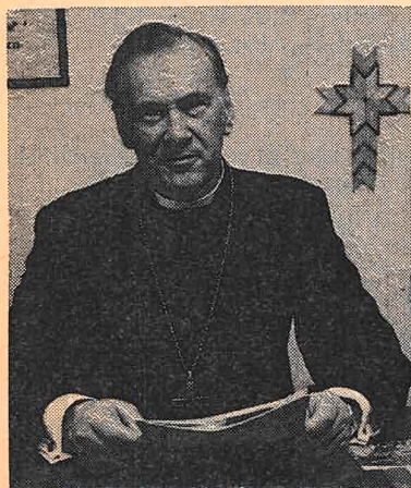
Biskop Hauge kommer til avslutningsfesten.