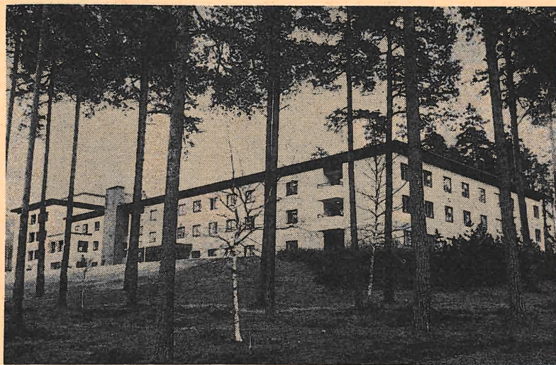
Modumheimen ligger vakkert til mellom furuene.

Modumheimen er nå fullt utbygd, med 107 sykehjems- og 25 aldershjemplasser. Institusjonen har vært fullt belagt hele det siste året. Gjennomsnittsalderen på Modumheimen er 82 år.