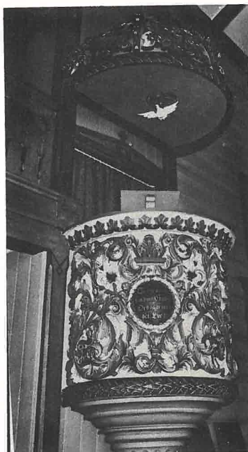
Fra Nykirkes talerstol er denne takksigelsebønn blitt lest i 1826

Med Tillid anraabe vi Dig om din vedvarende Naade og Beskyttelse: styrk vor elskede kronprindsesse, og lad os snart igjen med Glæde samles for dit Aasyn for at ofre Dig vore hjerters inderlige Takk for hendes kongelige høiheds fuldkommen gjenvundne helse.