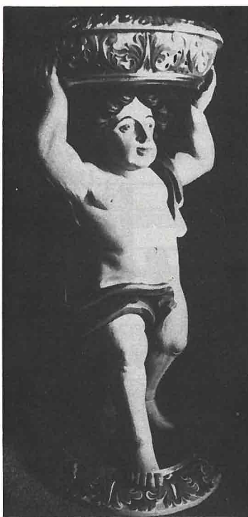
Døpefonten i Nykirke. Også dåpsliturgien blir nå forandret.

Ordningen for konfirmanttidens gudstjenester foreskriver nå tre gudstjenester hvor konfirmasjonen skal prege samlingen.