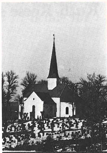
Hvor står kirken i moingens bevissthet?

Antallet gudstjenester er også høyere enn noen gang, selv om økingen bare er liten. Men hvor mange møter fram til gudstjenestene? Det har vi ingen statistikk på. Noen ganger er det bra, men mange av disse 215 gudstjenestene har samlet bare en menighet.