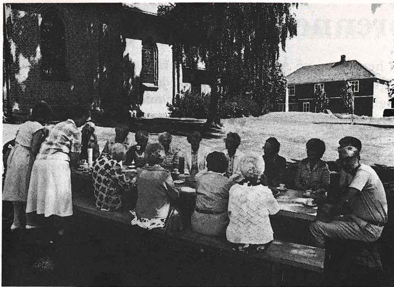
Hver gang det er gudstjeneste i sommer, og bra vær, så blir det kirke-kaffe ute på kirkebakken på Snarum. Dessuten blir her misjonsstevne, Olsokfest og Søndagsskolestevne for hele Modum.