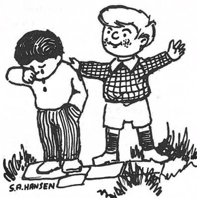
Fint å være sammen!

Vi startet lørdag kl. 15.00 og reiser hjem søndag kl. 15.00. Week-enden holdes på Nakkerud leirsted, så det blir kort reise. Vi starter lørdag med kaffe. Senere blir det aktiviteter for hele familien. Etterpå skal vi ha et lørdagskveldsmåltid der hver husstand tar med seg noe. Da blir det et skikkelig langbord med mye godt. Kvelden vil by på hygge for hele familien, samtale m.m. Søndag tar vi oss god tid til frokosten. Senere drar vi på familiegudstjeneste i Ruud kapell. Så blir det felles middag og avslutning på leirstedet. Hvis du vil ha enda flere opplysninger, så kan du ringe til en i komiteen. Navnene og telefonnr. til disse står under her. Menighetsweek-end har vært prøvd i mange andre menigheter med stort hell. Og vi håper at vi også her i menigheten skal lykkes med dette. Snakk gjerne med andre