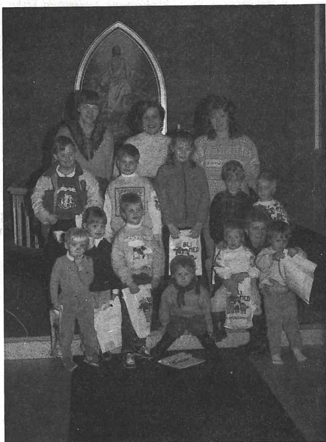
Søndagsskolen har startet opp igjen. Her ser vi noen av barna, og noen av lederne.