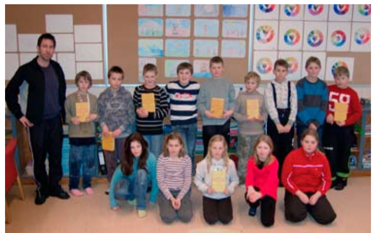
5. klasse Trømborg skole