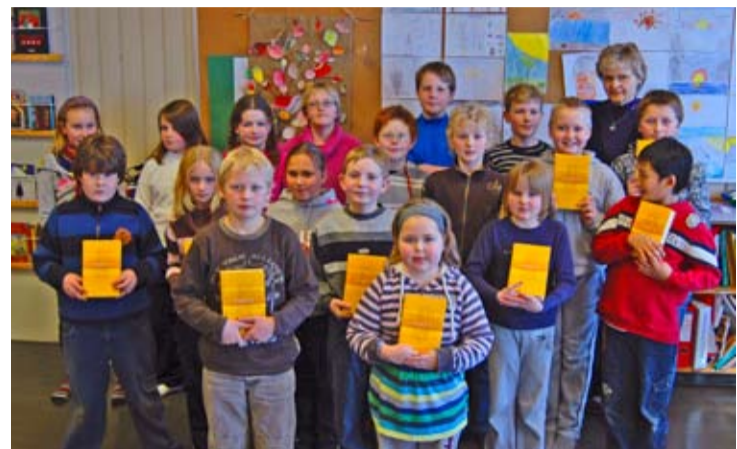
5. klasse Herland skole

ger, lærer og foreldre! Presten var imponert over hvor mye barna kunne om Bibelen!