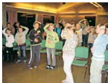
Fredagskveld var det sang og lek.