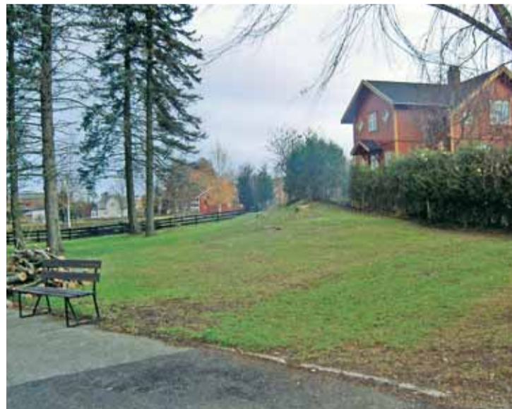
Mysen menighetsråd og Eidsberg kirkelige fellestråd er enige om at plenen øst for kapellet er egnet til minnelund.

Anonym gravlegging skjer i liten grad i Norge, men i Danmark og Sverige er slik gravlegging meget utbredt. Skikken kommer fra kontinentet. I løpet av vinteren vil vi utarbeide planer for en slik minnelund ved Mysen kapell.