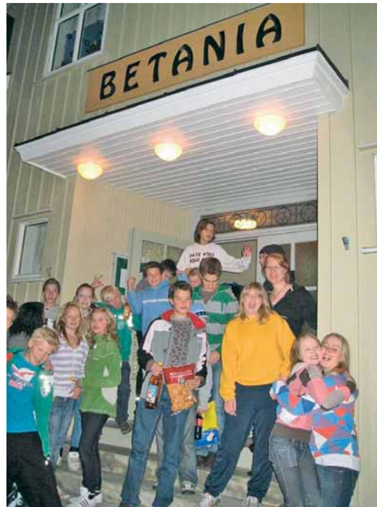
Koser seg: Ungdommene koser seg på Betania hver fredagskveld. Denne gangen var møtesalen omgjort til kino.