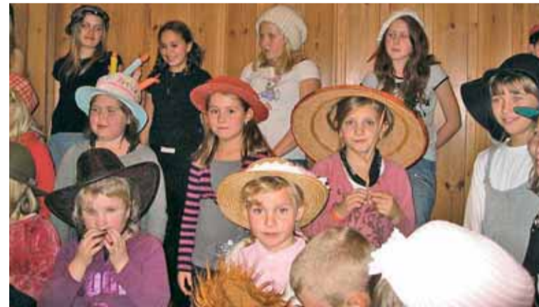
Sang med hatt: Lederne i Mysen barnegospel finner på mye gøy for sangerne. Denne øvelsen ble kjempespennende som hattefest.