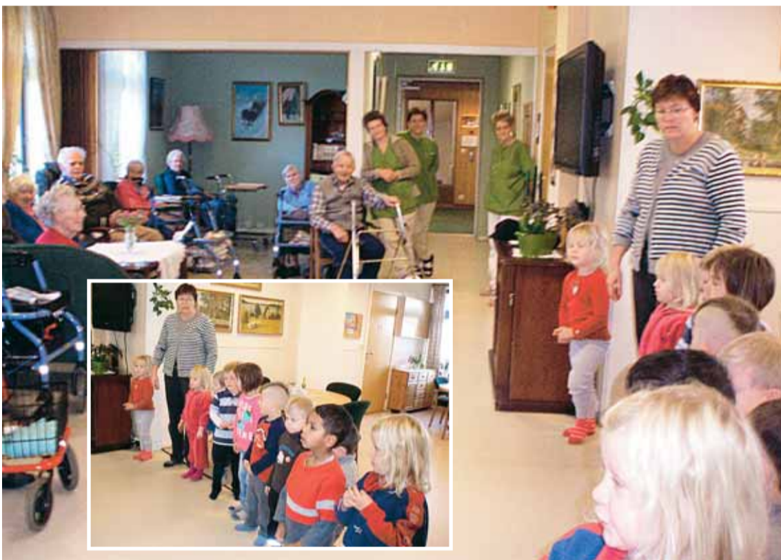
Store og små koser seg på Fossum bofelleskap. Barna underholdt med sang, dans og fine kråkestup.