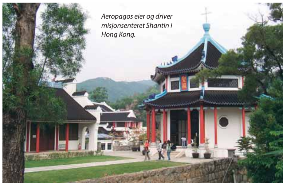
Aeropagos eier og driver misjonssenteret Shantin i Hong Kong.