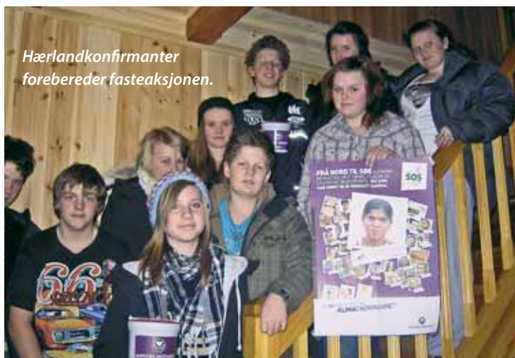
Hærlandkonfirmanter forebereder fasteaksjonen.

Ta derfor godt i mot konfirmantene når de banker på din dør! Du kan også støtte aksjonen gjennom givertelefon: 820 44 088 (175 kroner) eller via kontonummer 1594 22 87493