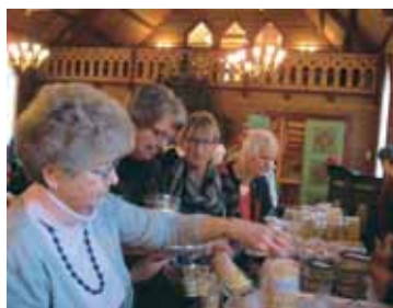
Salg av julebakst

støttet det med kaker og gaver, og de som har kjøpt kaker og lodd. Denne støtten gjør at vi fortsatt kan arbeide med å Ferdigstille kirkestua.