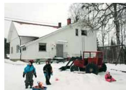
Hærland: Barnehage like ved Lundebyvannet.