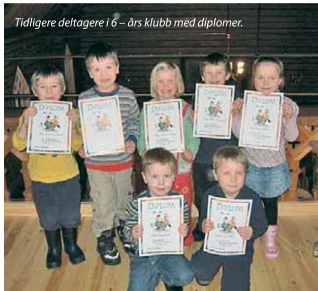
Tidligere deltagere i 6 – års klubb med diplomer.

I tiden før påske er det flere slike gudstjenester i kirkene våre i forbindelse med 6-årsklubbene og kursene i baby – og småbarnsang. VELKOMMEN!