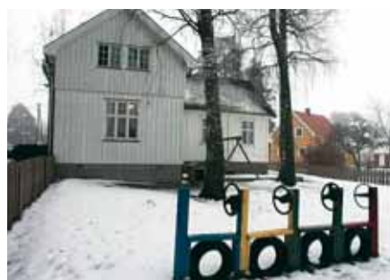
Hebron: Barnehage i nærmiljøet ved Eidsberg stasjon.

Du kan lese mer om aktivitetene i barnehagen på hjemmesiden: www.eidsberg.kirken.no