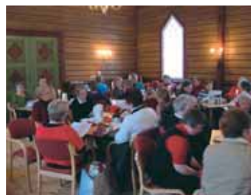
Servering og allsang