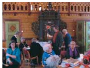
Trekning av utlodningen