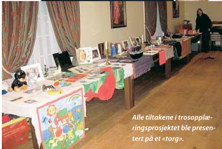
Alle tiltakene i trosopplæringsprosjektet ble presentert på et «torg».