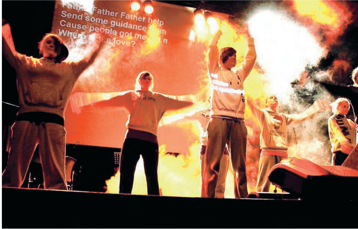
Dansegruppa i aksjon