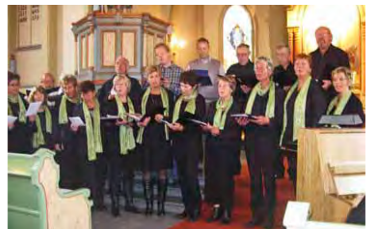
Eidsberg bygdekor deltok på gudstjenesten med fin sang.

Ingen dyr dør lettere og bedre enn de som tas i jakta. Naturen er brutal. Tenk bare på ulven og de voldsomme lidelsene den påfører byttet sitt. Men vi jakter som gode mennesker med omsorg og ettertanke."