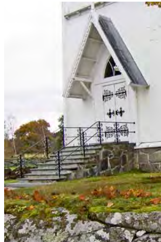
Det er stort behov for rullestolrampe ved Hærland kirke. Hovedtrappa er høy og bratt.

menighetsråd har gitt sin tilslutning til forslaget. Fellesrådet vil behandle saken i slutten av oktober. Forhåpentligvis vil rullestolrampen være på plass sommeren 2011!