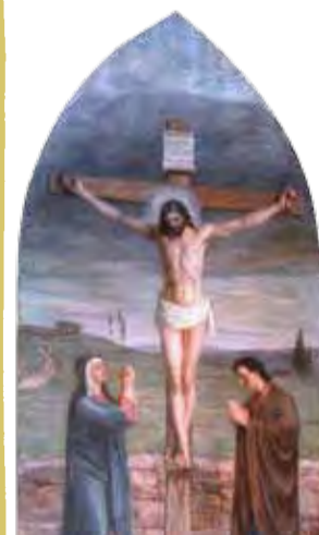
Altertavlen i Hærland kirke

Ved begravelser eller andre viktige hendelser/behov kan man ringe 908 79 560.