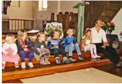
Konsentrerte barn i Eidsberg kirke