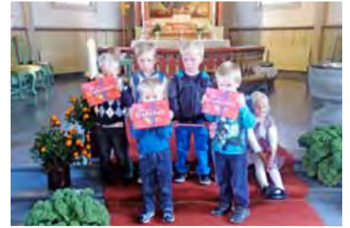
4-åringene i Trømborg viser stolt fram bøkene sine