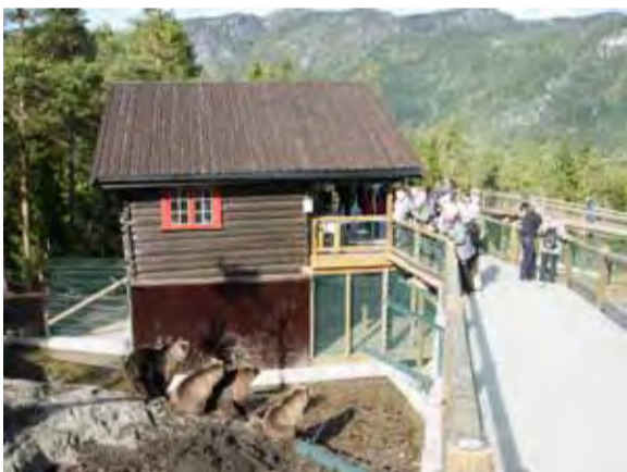
Bjørnene mates kl 12