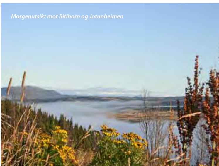
Morgenutsikt mot Bitihorn og Jotunheimen