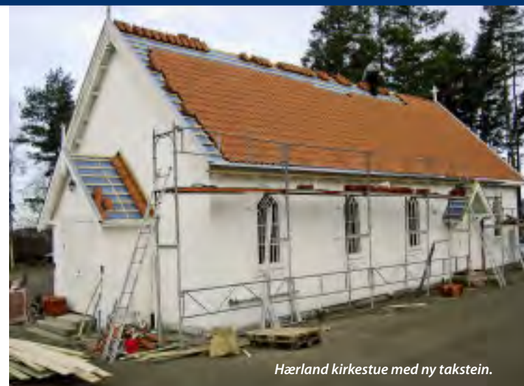
Hærland kirkestue med ny takstein.