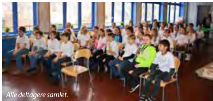
Alle deltagere samlet.

Vi var også i bassenget, dekorerte t-skjorter og så film i kinosalen. Nydelig taco- mat ble servert på Betania. I Mysen kirke var barna med på en bønnevandring. På slutten av dagen var familie og faddere invitert til en forestilling i kinosalen hvor de fikk se smakebiter fra festivaldagen.