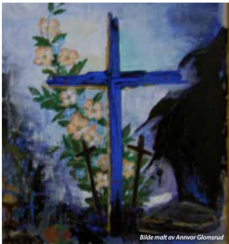
Bilde malt av Annvor Glomsrud

Dette er natten da Kristus brøt dødens lenker og seirende sto opp fra dødsriket. Det store påskelyset tennes, og alle står etter hvert med brennende lys. Påskennatt blir en også minnet om sin egen dåp, og det innbys til nattverdfeiring. Gudstjenesten