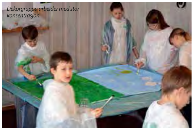
Dekorgruppa arbeider med stor konsentrasjon.