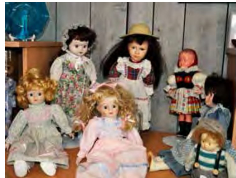
I brukbutikken kan man finne det meste til hus og hjem. Her er en avdeling med porselensdukker som er populært samlingsmateriale.