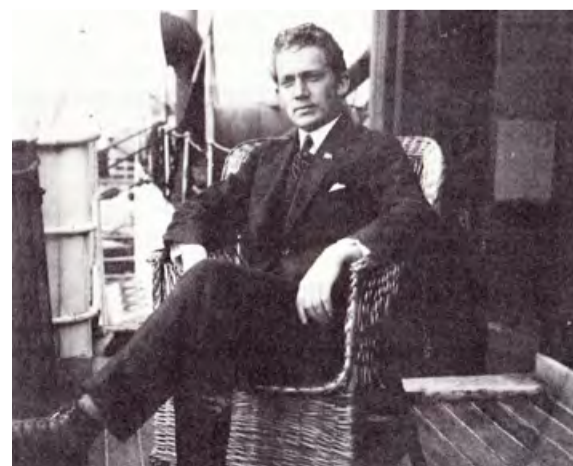
TRYGVE GULBRANSSEN

Det betyr ikke at en skal legge tvilen bort. Han skriver: «Det er ingen fare i verden for den som ikke frykter døden... Tanken er menneskenes største evne, men derfor er det også mange som gjør tanken til sin gud... Tvilen er det våkne i oss, men vi skal også tvile på vår tvil. Og troen på Gud er den sanne erkjennelse av at vi er sunne tvilere i livet – på våre egne evner. [...] Tro i praksis et konsentrasjonspunkt for alle de villsumme innfall. Uten tro ingen ro, og allikevel må troen ikke bare bli en hvileplass, tvertimot, den er et mål langt ute ved den kronglete og farlige livsveiens ende, et lys i mørket å styre fram mot.»