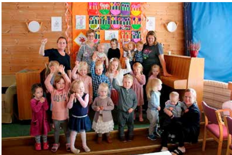
Barn og personale underholder