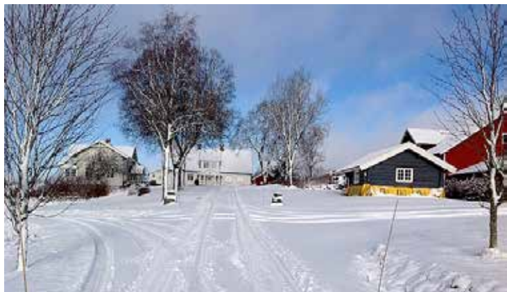
Hvit og stille vinterdag på Dal.

I bryggerhuset skulle alle få sin vask etter tur. Det skjedde lillejulaften.