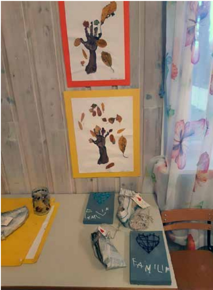
Barna på avdelingen Hebron laget kunst til Stefanus-kafeen.

har vi fine skogsterreng som vi bruker flittig – gjerne flere ganger i uka. På avdeling Hebron er barna ekstra ivrige på å gå lange turer. En dag gikk de faktisk gjennom skogen helt til avdelingen i Trømborg. Da var det fint å få leke på lekeplassen der og så bli hentet med bil av foreldrene på ettermiddagen.