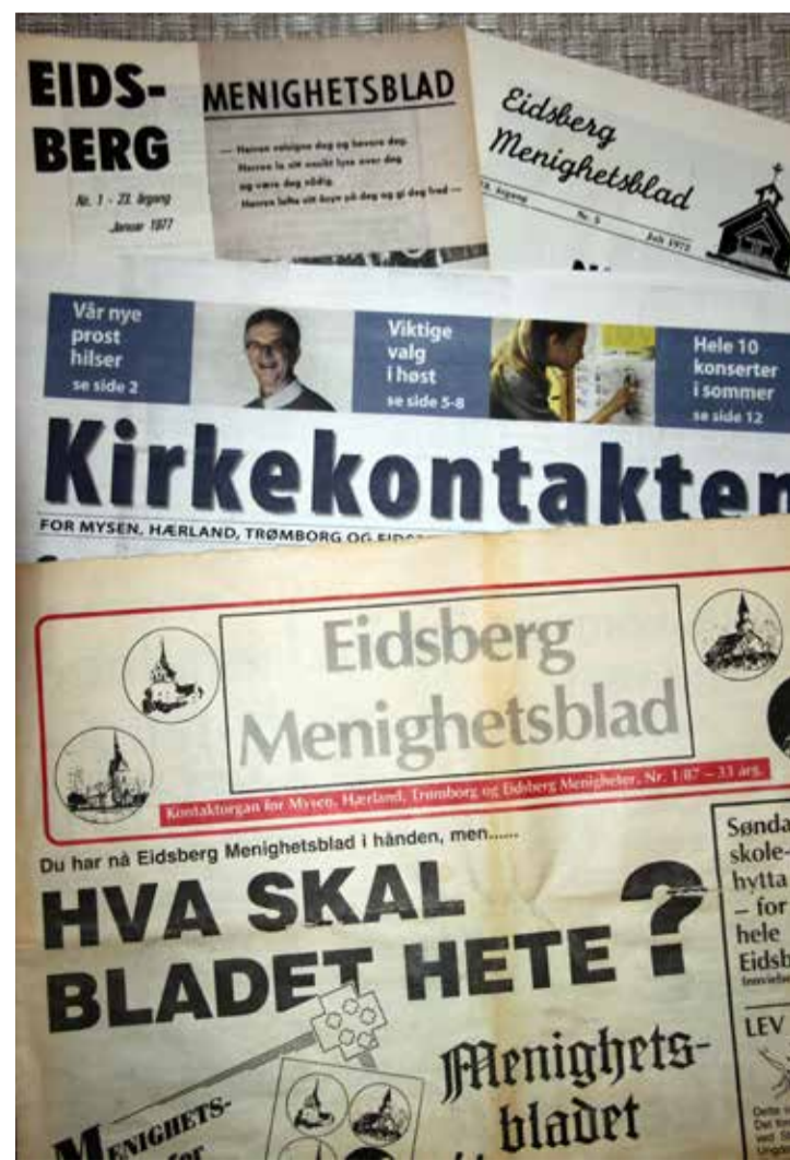
Et lite knippe av menighetsbladet for Eidsberg. I 1987 ble menighetsbladet lagt om til avisformat.

Når vi går inn i 2020, er Kirkekontakten historie. Men det er alles ønske at et nytt menighetsblad ser dagens lys så raskt som mulig. På sin måte kan det være med på å knytte de fem kommunene sammen og markere kirkens plass i den nye Indre Østfold kommune.