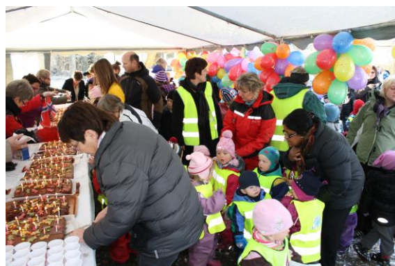
Kaker til alle i barnebursdagen