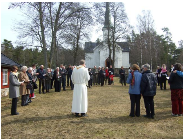
Vi synger påskesalmer etter påskekudstjeneste