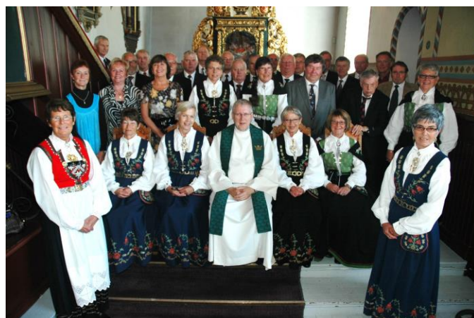
50-års konfirmanter i Trøgstad