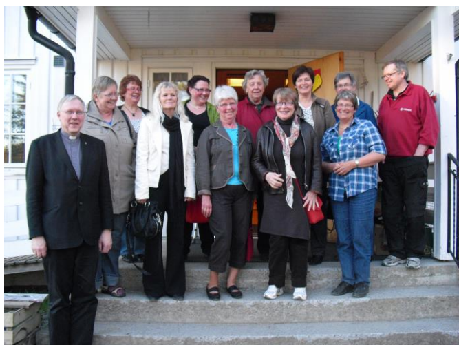
Et knippe av våre kirkeverter

Gudstjenesteutvalget jobber bl.a. for å trekke flere med i gjennomføringen av gudstjenestene .