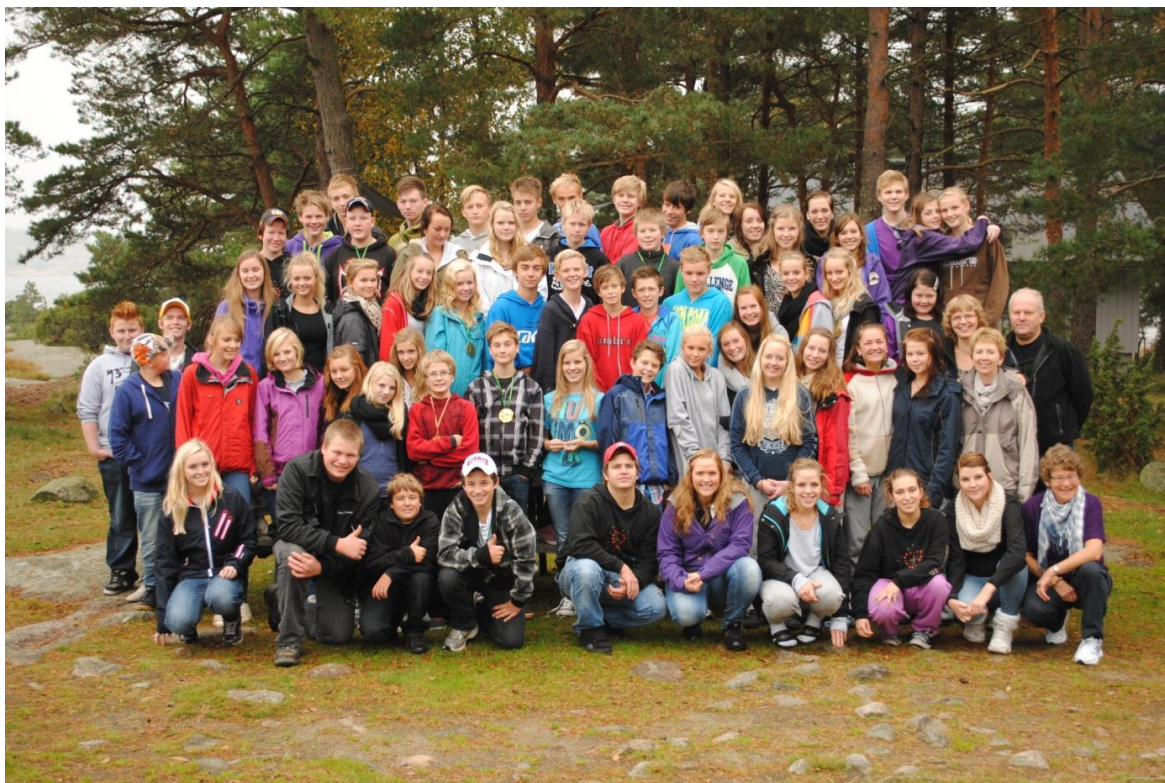
Konfirmanter 2011/2012 på Tjellholmen leirsted

Høsten består for det meste av undervisningstimer i basistemaer som Gud -vår skaper, Jesus - Guds Sønn, dåp, nattverd; Bibelen osv. Første helgen i høstferien var vi på weekend på Tjellholmen som vi pleier. Det var stor suksess og vi hadde mange fornøyde konfirmanter og ledere med oss hjem. Alle konfirmantene har en søndag med kirketjeneste sammen med kirketjenerne, og en søndag med samtalegudstjeneste sammen med soknepresten. I tillegg skal de gå på 4 gudstjenester som de velger tidspunktet på selv.