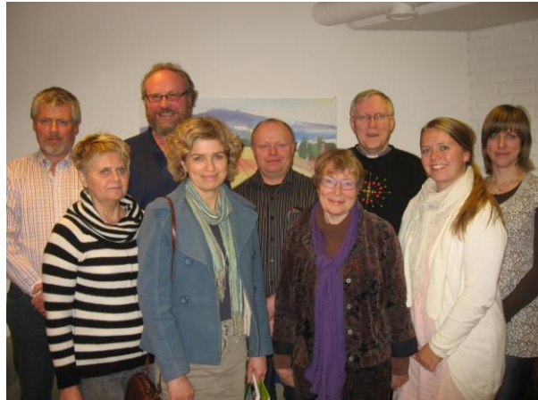
Nyvalgt menighetsråd i Trøgstad og Båstad menigheter

Arbeidet godt og på valgdagene 11. og 12. september 2011 var det god oppslutning om det kirkelige valget. 13,6% av de stemmeberettigede deltok i valget i Trøgstad menighet, og tallet for Båstad menighet var 16,5%. Det kirkelige valget fant sted på samme sted som valget til kommunestyret (kommunehuset) og fulgte stort sett samme opplegg også for forhåndsstemming. Antall forhåndsstemmer steg noe ifht forrige valg.