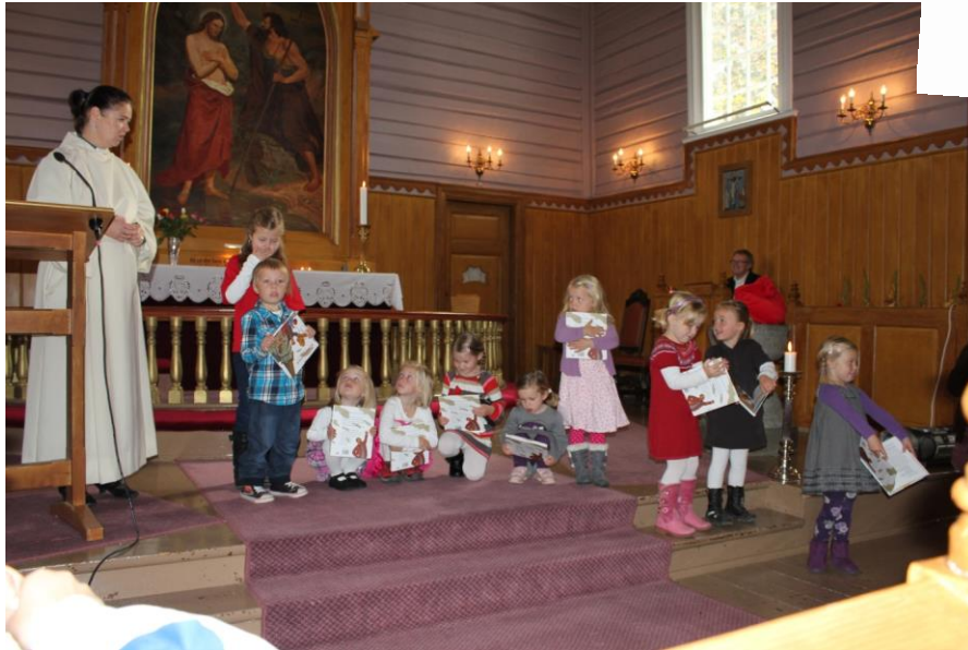
Utdeling av Kirkeboka til 4-åringene