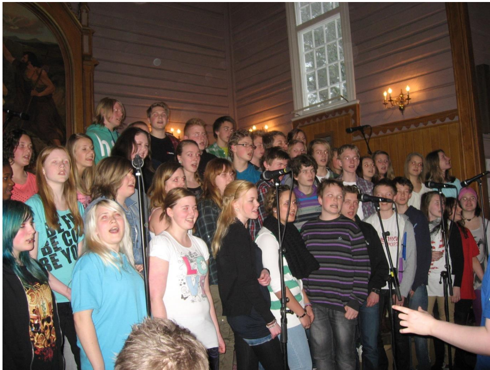
Konsert i Båstad kirke april 2011 – med alle konfirmantene og Ten Sing Norway-teamet!