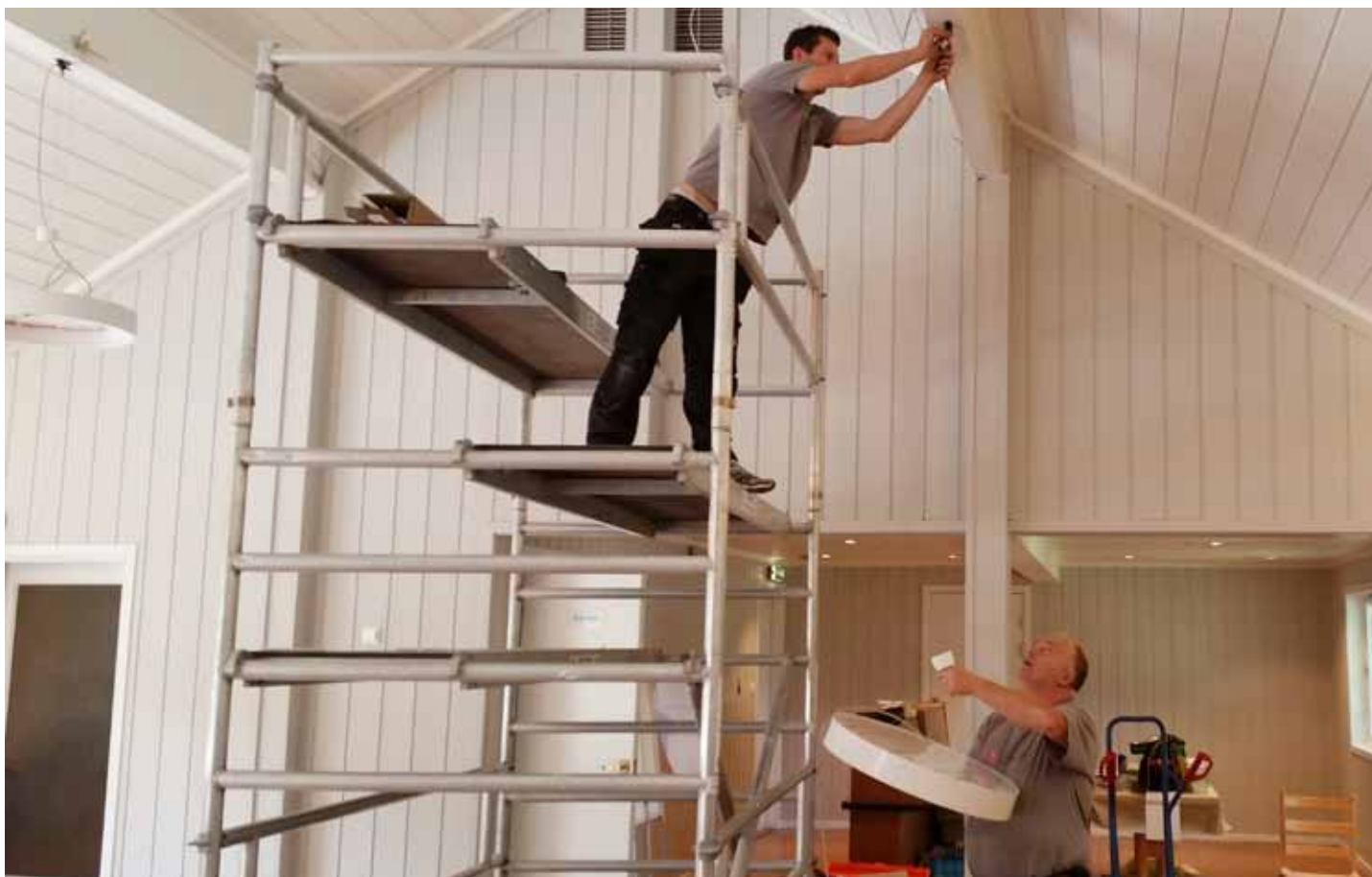
Bildene viser noe av det som har foregått i løpet av sommeren med oppussing av Kirkestallen