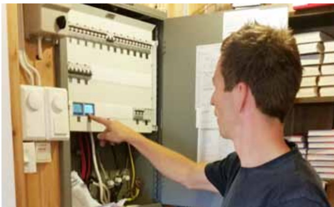
Det har blitt malt. Ny belysning og nytt el-anlegg har blitt installert av lokale aktører

alt kan ikke bli gjort på et år. Så som innkjøp av lette sammenleggbare ekstrastoler, nye gulvbelegg i flere rom, ny taktekking på den eldste bygningsdelen, tilbygg av lager for f.eks. stoler, male og pusse opp vestibylen, maling av vegger og vinduer utvendig med mer. Alt dette koster mye penger og skal følgelig finansieres. Det arbeides derfor med en samlet og oversiktlig plan som fortløpende vil bli oppdatert, og oppgavene vil så bli prioritert i h.h.t. nødvendighet og finansieringsmulighet. For at alt dette, og kanskje enda mer, skal kunne gjennomføres er nok husstyret/menighetsrådet avhengig av noen snille givere.