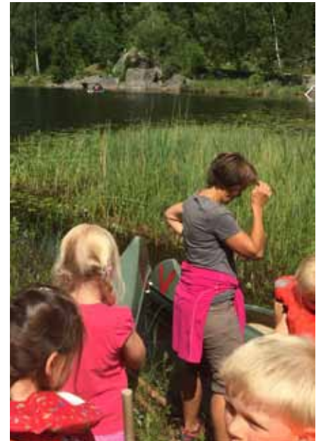
Hestestell, bevervandring (med utstoppet bever) og kanopadling i Østmarka.