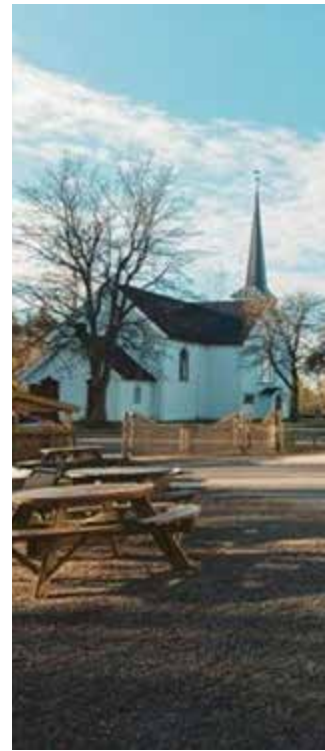
Bilder fra Kirkestallen barnehage på Skjønhaug og Kirkestua barnehage i Båstad.