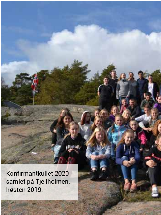
Konfirmantkullet 2020 samlet på Tjellholmen, høsten 2019.