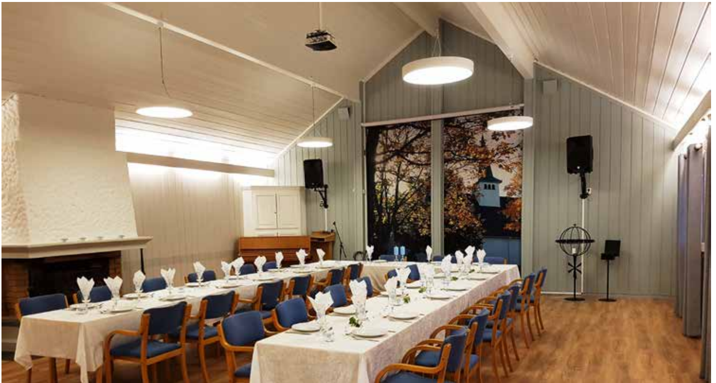
Krikestallen dekket til fest.