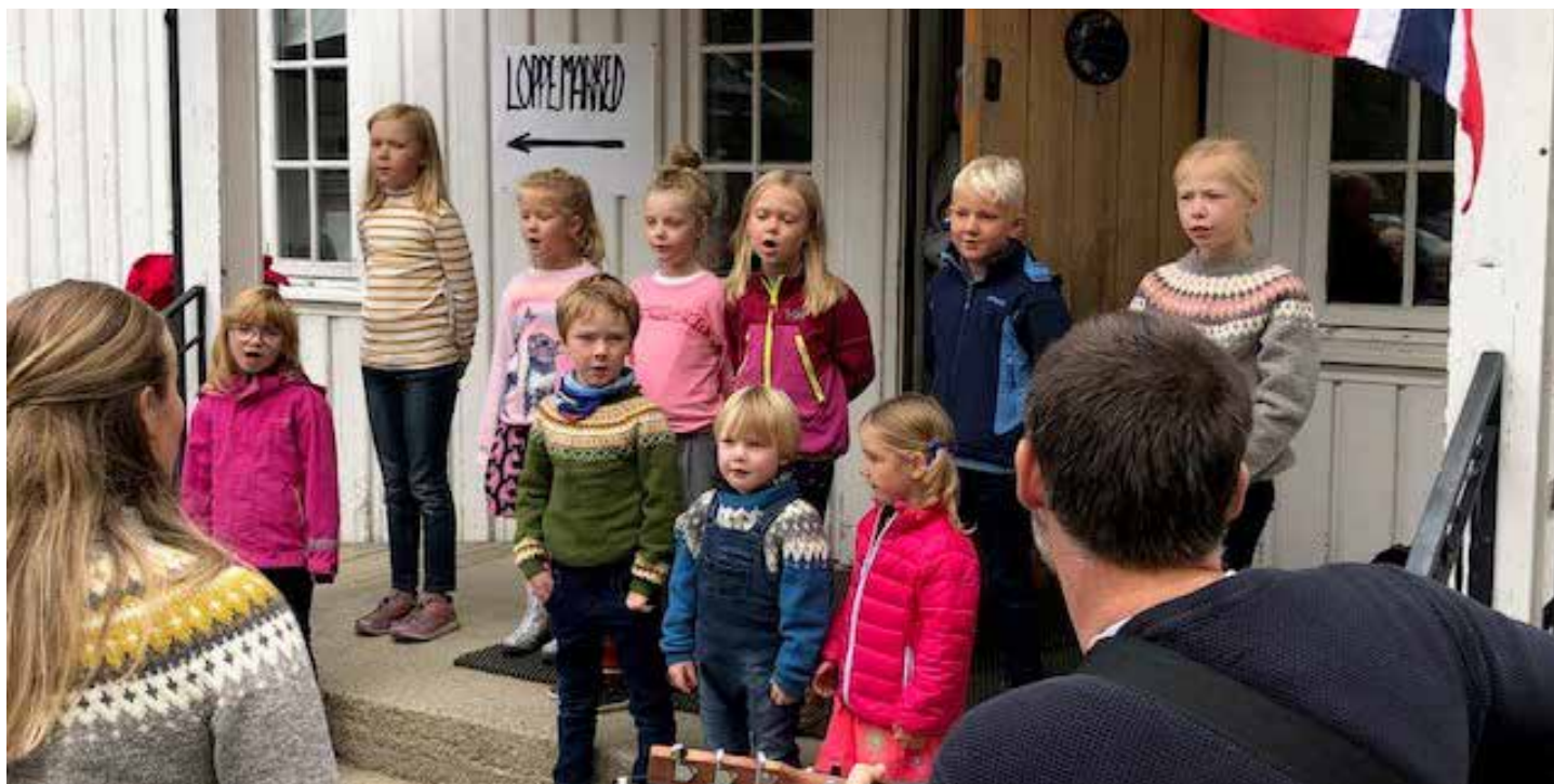
Trøgstad barnegospel synger på høstsalget i Kirkestua.