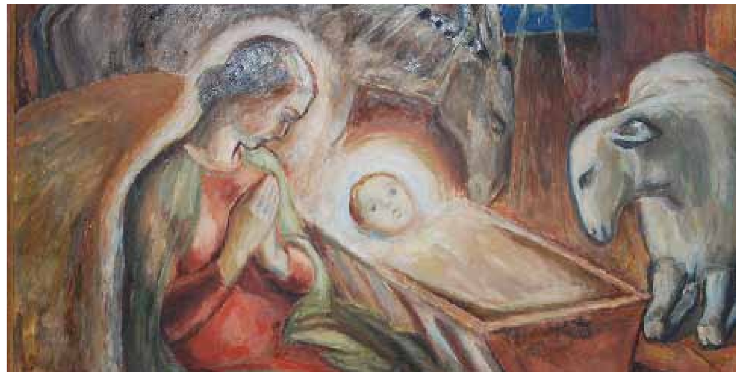
Altertavle Tistedal Kirke.

Trykk: Østfold Trykkeri, Askim - Design: KLDesign