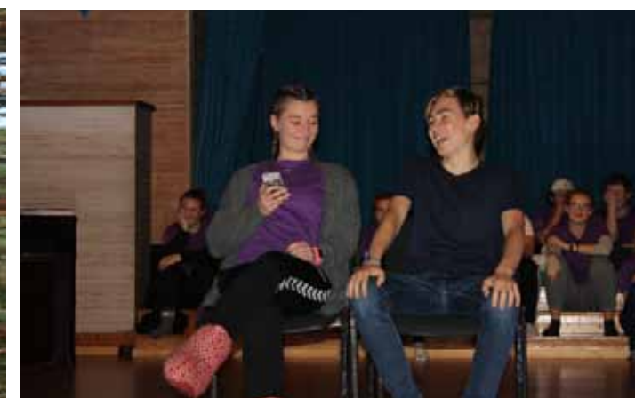
Bilder fra konfirmantleiren på Tjellholmen.