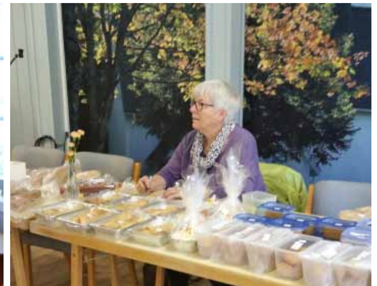
Dugnadsånden lever ved hjelp av positive mennesker.