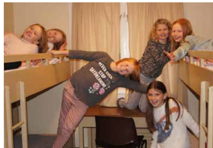
Bilder fra diverse lek og aktiviteter på Amigosleiren på Sjøglimt.