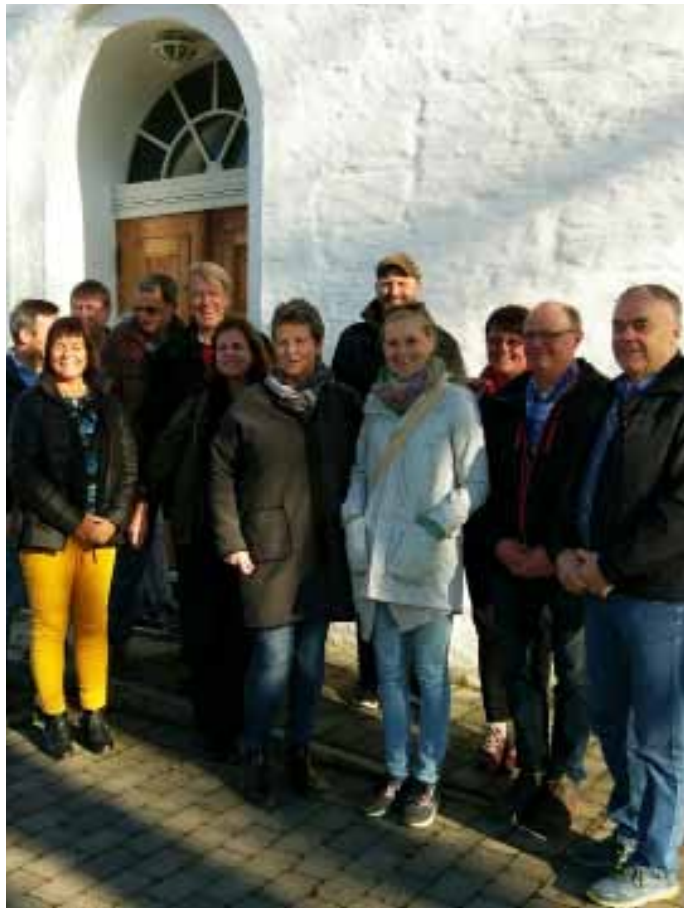
Fellesnemnda og kirkevergene på befaring i Indre Østfold, her ved Spydeberg Kirke.