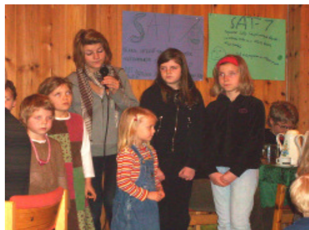
Båstad Barnegospel synger ut!