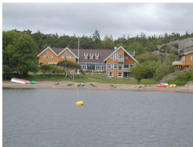
Sauevika leirsted sett fra sjøsiden

Nærmere opplysninger og påmelding: Normisjon, Region Østfold,