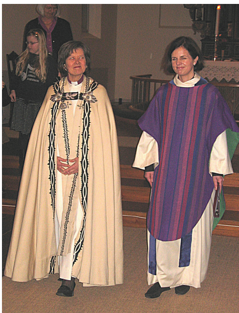
Den nye prosten (th) og biskop Helga Byfuglien avbildet ved innsettelsesgudstjenesten i Eidsberg kirke palmesøndag.

Hei og takk for invitasjon til å skrive en liten presentasjon til menighetsbladet - det var hyggelig! Takk også for den flotte boken om Trøgstad kirke og det fine kortet av Båstad kirke jeg fikk fra menighetsrådene til min innsettelse - jeg gleder meg til å bli kjent med dere og å få se de vakre kirkene.