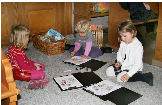
Fra Båstad kirke, fargestifter og barn.