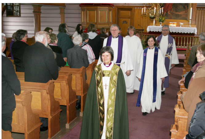
Biskopen leder utmarsjen i Båstad kirke etter gudstjenesten