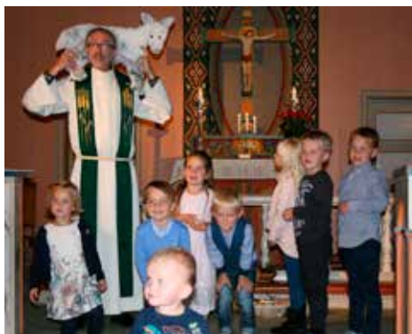
Heldigvis ble sau "Bææærtil" funnet i god behold.