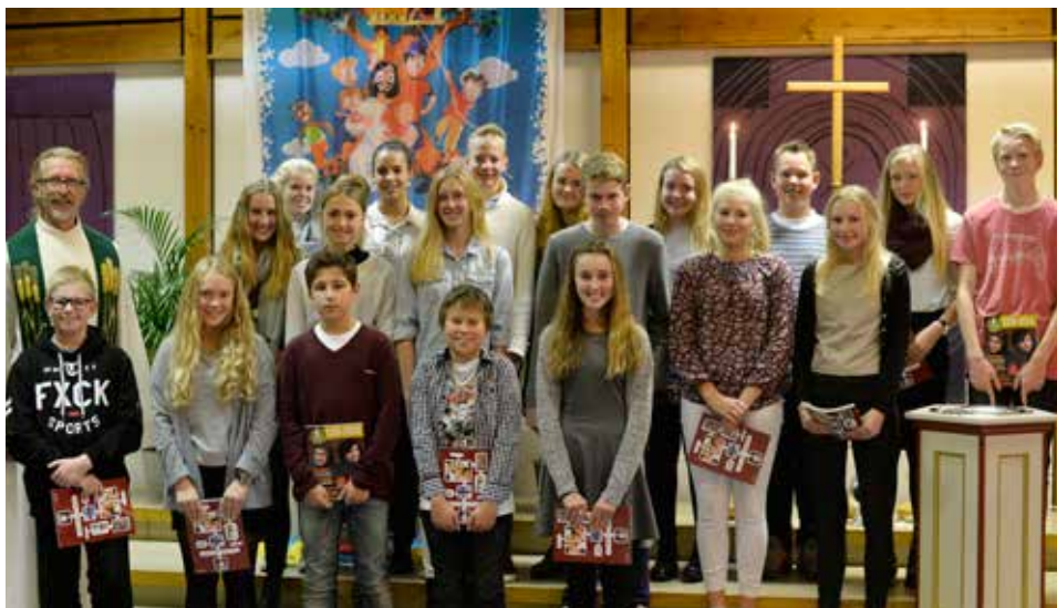
En flott bukett ungdommer!

Det har meldt seg 19 konfirmanter til Ørje. Under kveldsgudstjeneste i Ørje kirke den 18.10 ble disse presentert: