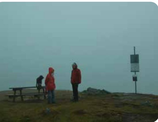
Ikke mye utsikt fra Gurisethøgda i år