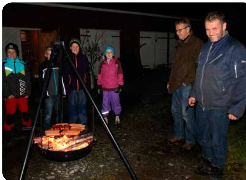
Er pølsene snart ferdig?