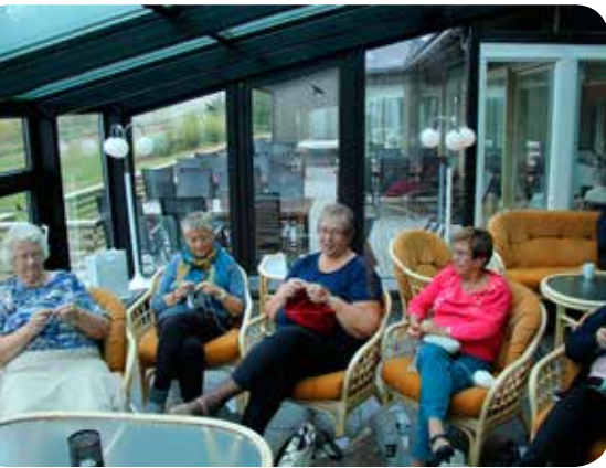
God tid til håndarbeid og deilig å være under glasstak