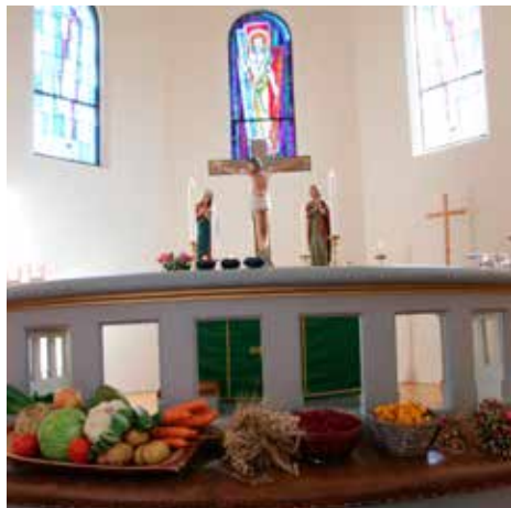
Fint pyntet med høstens grøde