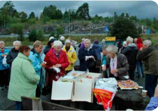
Kafferast på Hønefoss