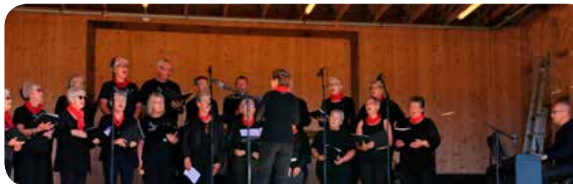
MarkCanto deltok med mye fin sang