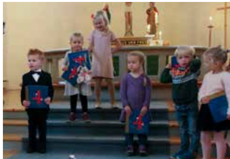
Her er 4-åringene som møtte denne dagen og mottok Min kirkebok