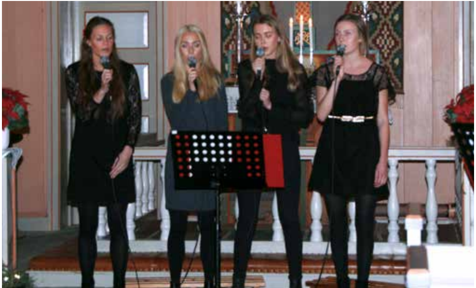
The reason we sing