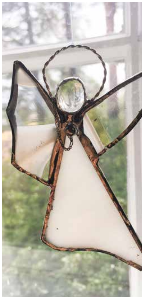
Engelen er fra vinduet i Ørje kirke.

Alle som døpes, får en glassengel som henges opp i kirkene. Denne engelen henger frem til nyåret. Da blir de tatt ned, og dåpsbarna og familiene inviteres tilbake til kirken på en «Hente-engelgudstjeneste». Når glassenglene henger i kirkene, er de en påminnelse til hele menigheten om ansvaret den har: å be for barna.