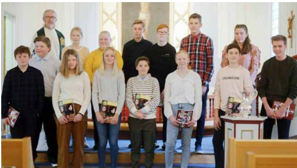
Ørje og Øymark