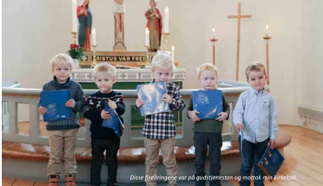
Disse fireåringene var på gudstjenesten og mottok min kirkebok.