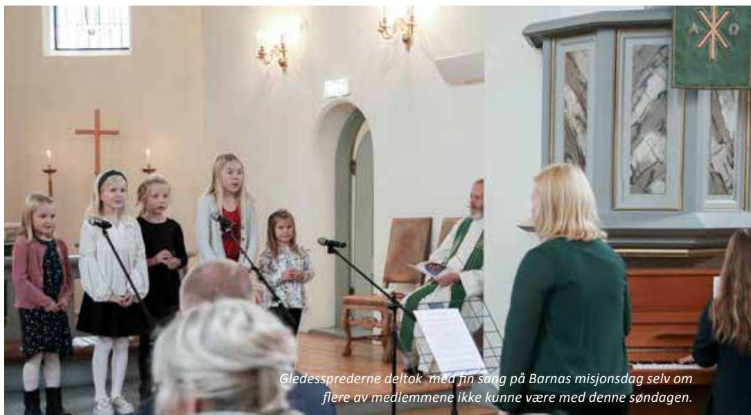
Gledessprederne deltok med sin sang på Barnas misjonsdag selv om flere av medlemmene ikke kunne være med denne søndagen.