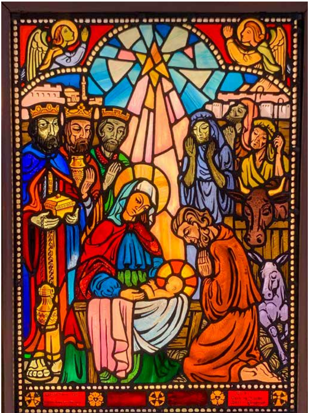
Altartavlen i Mangen kapell