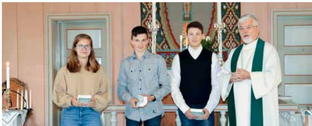
Neste års konfirmanter