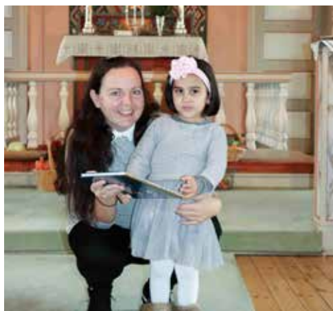
Overrekkeelse av 4-årsbok

Etterpå var det kirkekaffe, og der var det mye godt!