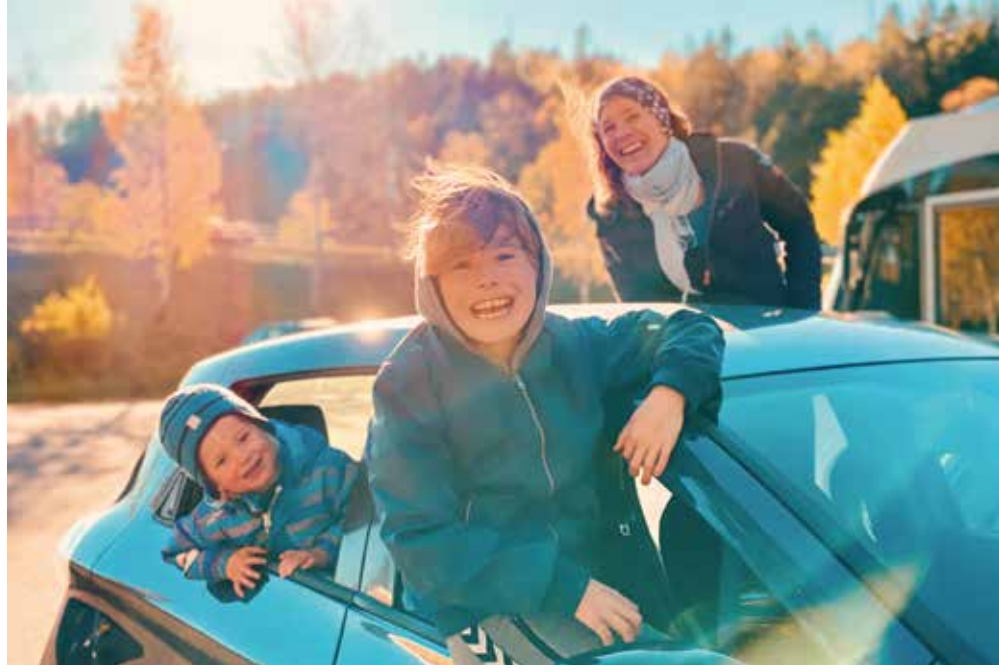
Familien Sæther klar for bilrebus