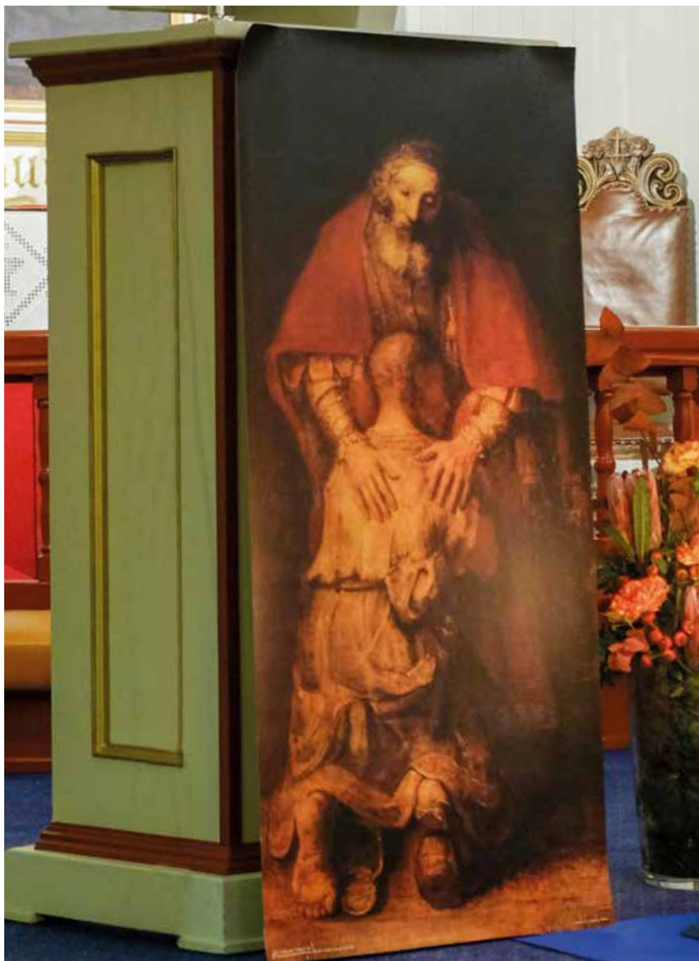
Forfatteren var inspirert av dette maleriet av Rembrandt fra samme tema.