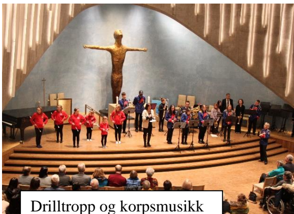
Drilltropp og korpsmusikk