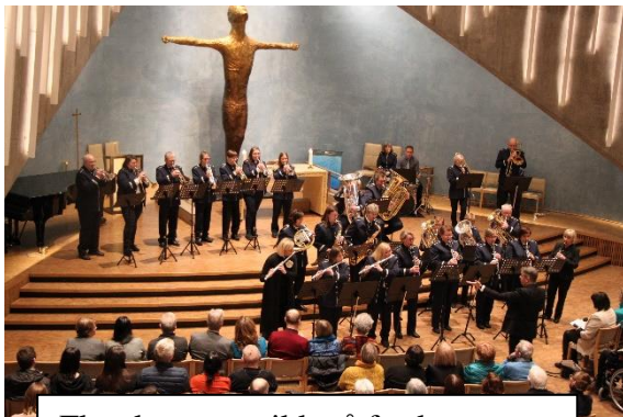
Flott korpsmusikk på festkonserten