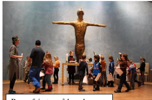
Barna feiret også bursdagen.