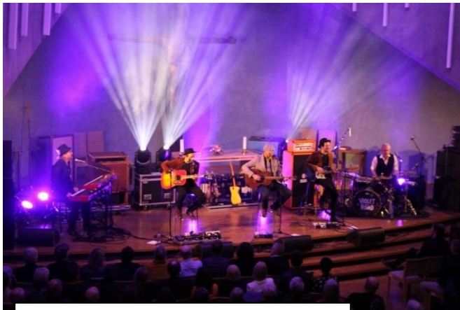
To konserter med Violet Road