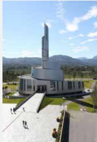
Nordlyskatedralen Alta kirke

Søndag 11. des. kl. 11.00: Gudstjeneste Søndag 18. des. kl. 11.00: Gudstjeneste Julaften, 24. des. kl. 13.00, 14.30 og 16.00: Familiegudstjeneste 1. juledag, 25. des. kl. 11.00: Høytidsgudstjeneste Søndag 1. januar kl. 11.00: Gudstjeneste Søndag 8. januar kl. 11.00: Gudstjeneste Søndag 15. januar kl. 11.00: Gudstjeneste Søndag 22. januar kl. 11.00: Gudstjeneste Søndag 29. januar kl. 11.00: Gudstjeneste Søndag 5. februar kl. 11.00: Gudstjeneste Søndag 12. februar kl. 11.00: Gudstjeneste Søndag 19. februar kl. 11.00: Gudstjeneste Søndag 26. februar kl. 11.00: Gudstjeneste Søndag 5. mars kl. 11.00: Gudstjeneste Søndag 12. mars kl. 11.00: Gudstjeneste