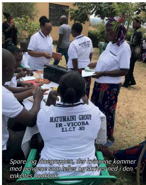
Spare- og lånegruppen, der kvinnene kommer med pengene som telles og skrives ned i den enkeltes bankbok.

I alle de gruppene vi møtte hilste de hverandre og oss med følgende hilsen: «Dini Mballi-bali. Upendo na Amani!» «Religioner mange - mange. Fred og kjærlighet.» Det er gjennom dialog at en kan bygge fred, forsoning og framtid sammen. Tanzania er et multireligiøst land med de utfordringer det kan bringe med seg. Kirkens Nødhjelp bidrar til dialog mellom mennesker på tvers av religion, både blant religiøse ledere og den enkelte samfunnsborger. KN har etablert et dialogforum for religiøse ledere for å øke forståelse for hverandre gjennom dialog. Vi fikk møte de religiøse lederne, både imamer og prester, og fikk del i de utfordringer de så at samfunnet rundt dem hadde. De var opptatt av å fokusere på det en har til felles framfor å se kun på det som skiller dem fra hverandre. I dette minner de hverandre om det afrikanske ordtaket: «I am, because you