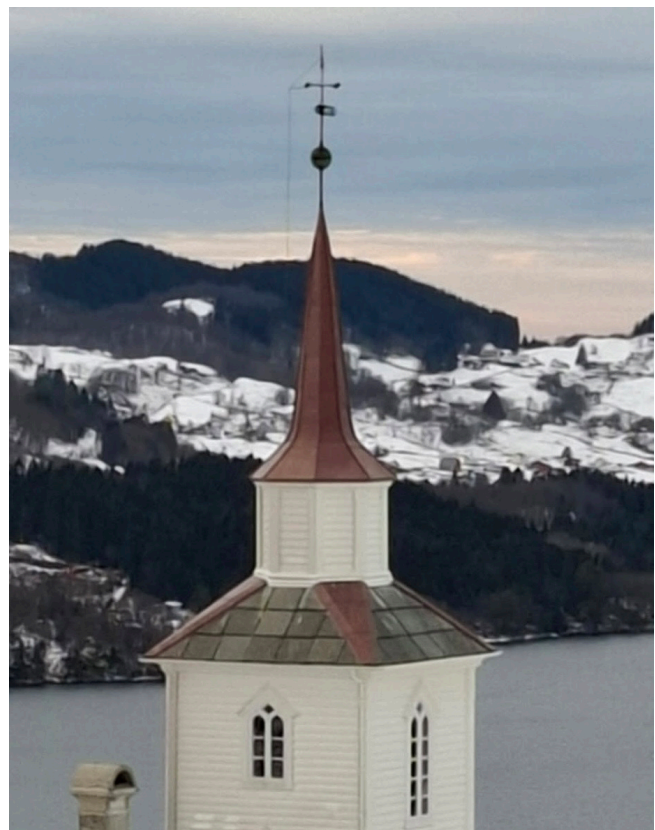
NY KOPAR: Spiret og dei fire hjørna er belagt med ny kopar.