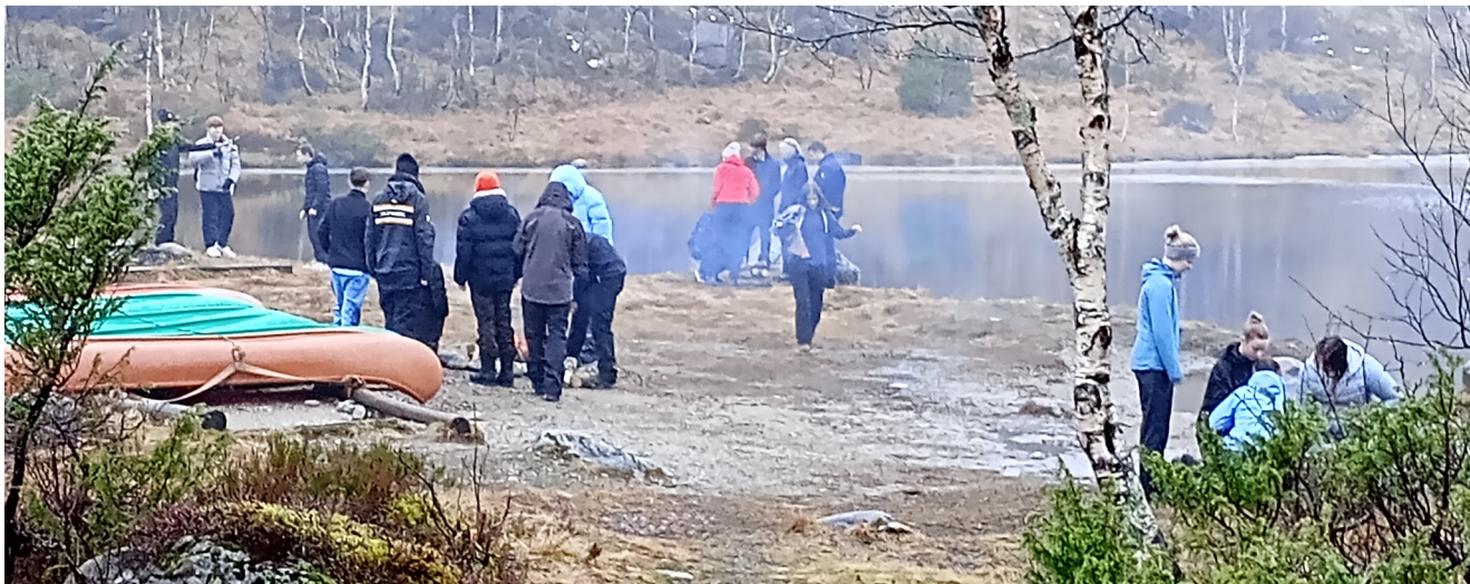
Bålbrenning og andre uteaktivitetar sto på programmet då konfirmantane var på leir på Dyrkolbotn leirskule i januar.